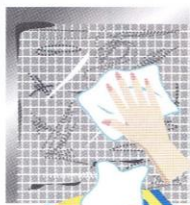
フローリング用ウェットシート

細かい汚れがこびりついた網戸掃除には、「フローリング用のウェットシート」をつけて軽く網戸を拭くと簡単に綺麗になります!ぜひお試しください!