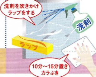
洗剤を吹きかけラップをする

汚れがひどい場合、「ラップ」を使用すると綺麗に汚れが取れます。洗剤を窓ガラスに吹きかけ、ラップをかぶせて10~15分置き、その後カラぶきをすれば綺麗に汚れが取れますよ!