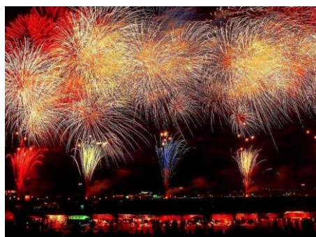
2013年 花火師による競演

筑後川の花火大会は見ごたえがありますね、一度は行きたいと願っていますが秋田県大曲の花火師による競演。毎年多くの方が詰めかける全国的にも有名で、花火師憧れの舞台だそうです。今年は8月23日(土曜日)開催予定。いつかは行きたいものです。